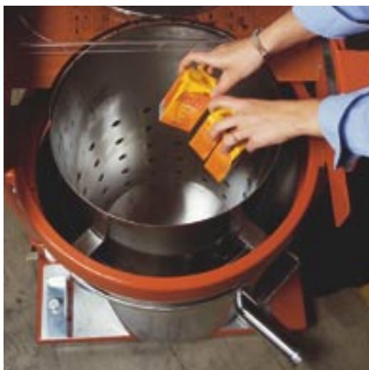
Tömörítés közben a folyadék \varnothing 5 cm csövön folyamatosan elvezethető.

Tej, üdítő és más romlandó élelmiszer gyártók és forgalmazók esetében néha szükséges a kartondobozok nagy tételben történő ürítése. Az ORWAK 5030-CE összepréseli a karton dobozokat, a folyadékot a kamrából egy csövön keresztül elvezeti.