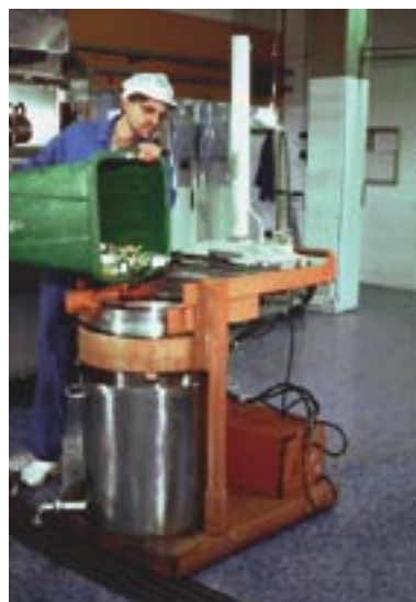
Folyadék kiválasztás. A kritikus elemek rozsdamentes acélból készülnek.