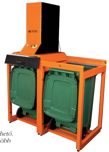
A kamrák száma bővíthető. A hulladék egyszerre több kamrába tölthető.