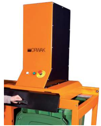
A tömörítő fej a kamrák felett könnyen mozgatható. Kezelése egyszerű és biztonságos.

A min. 1/3 tömörítési arányának megfelelően a hulladékkezelési költségek 2/3 része.